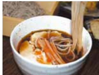
自家製ラー油がきいた「とり辛せいろ」