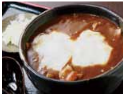
人気のもち入りカレーうどん980円