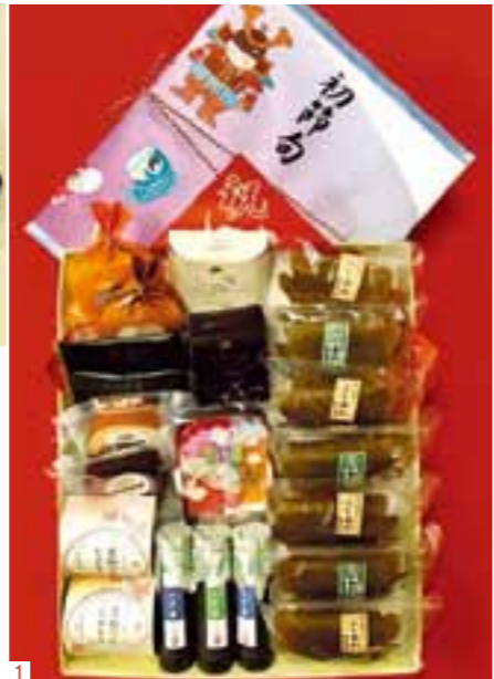
1.かしわ餅セット「松」3,880円(かしわ餅のみの折詰めも有り) 2.かしわ餅1個130円(各税別)