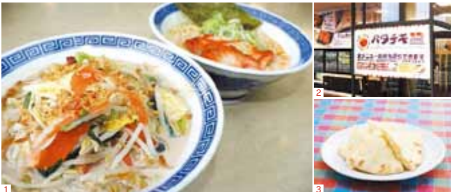
1.野菜醤油(手前)鶏白湯(奥) 2.Aコープあがつま店内で便利 3.県産の小麦を使ったチーズナン

「野菜醤油らーめん」680円 甘みのある上品な醤油スープに、野菜をたっぷりトッピング。自家製ネギ油が芳醇な香りを醸し出す! 「鶏白湯らーめん」680円 鶏白湯スープに特製塩ダレ。選りすぐった中細麺。バタチキ自慢のタンダリーチンをのせた。本商品は老若男女を喜ばせる逸品!