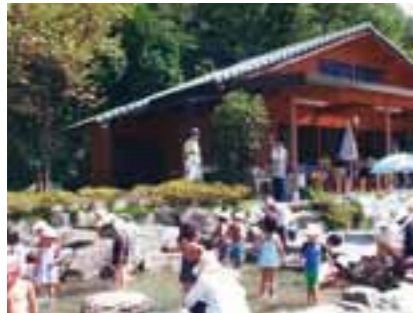
ニジマス、イワナなど1時間1,400円〜(つり放題)