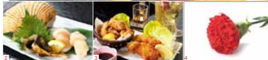
1.晩春のうまいもん入荷!「旬盛り」890円(税抜) 2.身がしっかり詰まった「天然活ほたて」600円(税抜) 3.ハイボールにはまぐる唐揚げとまぐる串カツがオススメ! 4.5/13は母の日!先着順でカーネーションをプレゼント♪