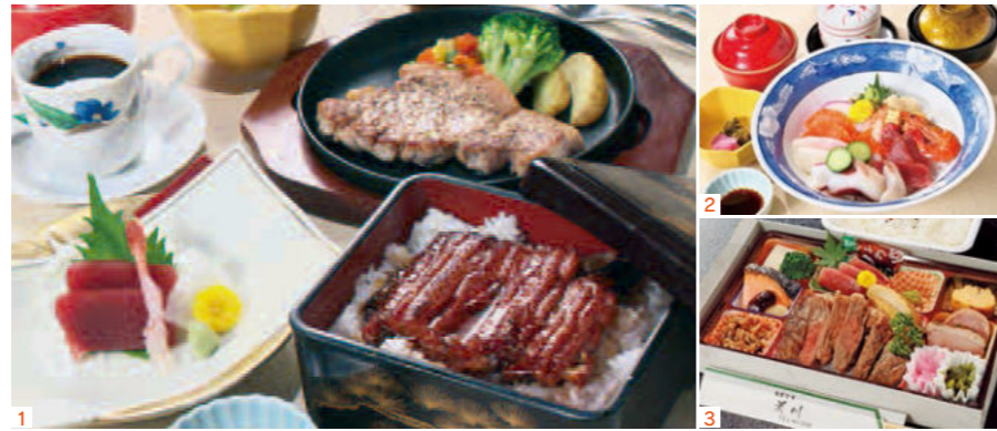
1.6月の夕膳 2.海鮮ちらし膳 3.仕出し専門ステーキ弁当

6月の夕膳1,980円(税込2,178円) うな重・赤城山麓もち豚ステーキ お造り・お替り自由のご飯 椀物・香の物・小鉢・ドリンク付き